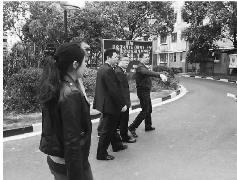
美丽小区、幸福家园这是民众的期盼也是我们物业公司的工作目标。在镇政府领导的关心下，在集团的支持下，我们将

领导们在视察中对目前进行的小区综合治理整治工作表示满意，认为改造后的小区道路、绿化有了明显改善，对于物业的保洁、秩序维护服务也给予了肯定，居民的居住舒适度和满意度大幅提高。同时，区领导要求进一步保持物业服务质量，对沿街商铺招商进行严审核，招牌要统一。在改造过程中，要因地制宜新建停车位、绿化、养老、文娛等公共设施，尽量满足居民的合理诉求，让百姓在改造工作中有获得感。