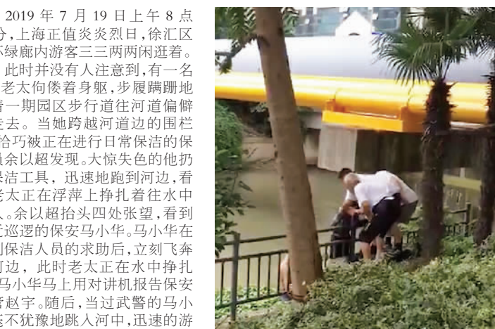
抗美援朝 保卫祖国

学校放假期间,华东理工大学党支部的于老师组织在校的一些党员和青年团员前往参观奉贤“中国人民志愿军纪念馆”,我本人也很荣幸能参加这次活动。上午8点半,我们所有人准时乘上校车前往目的地。 上海中国人民志愿军纪念馆坐落在上海奉贤永福园陵内。永福园为纪念在抗美援朝战争中的英雄,把他们的事迹树立传,使其永远传承下去,建造占地36亩的志愿军纪念馆,其中由中央军委原副主席、国防部长迟浩田上将题名的纪念馆占地1500平方米,分两期建设,由军史馆、英雄馆、专题馆、放映厅、展示厅、将军馆等组成,主要装饰布局以上甘岭抗道风格为主体,让参观者有身临其境的感觉。纪念馆通过翔实的历史资