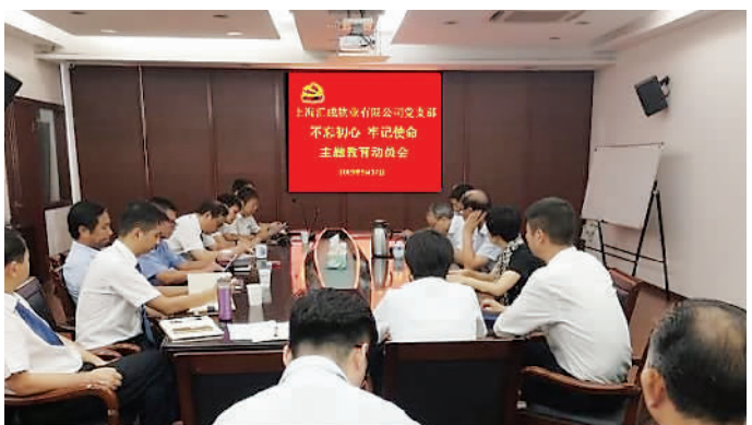
们企业的实际情况,把学习教育、调查研究、检视问题、整改落实贯穿主题教育全过程;对照党章党规

为认真贯彻落实中央、市委、区委关于开展“不忘初心、牢记使命”主题教育的相关部署要求,不断提高汇成物业党员同志的政治素质和思想水平,汇成物业党支部结合公司实际情况,根据上级集团党委《实施方案》要求,制定工作方案,积极落实此次主题教育工作。 一、全面启动部署 汇成物业党支部组织全体党员于9月17日下午召开“不忘初心、牢记使命”专题部署动员会议,党支部书记组织大家认真学习了集团党委下发的《开展“不忘初心、牢记使命”主题教育的实施方案》,强调要明确开展这次主题活动的重大意义,贯彻守初心、担使命、找差距、抓落实的总要求,并根据我