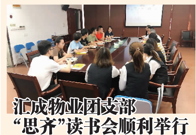
汇成物业团支部“思齐”读书会顺利举行

2019年7月30日,上海汇成物业团支部“思齐”读书会顺利举行。此次读书会也特别邀请到党支部书记在临,与所有团员共同分享现阶段的心得体会。 读书会伊始,所有团员对本次阅读的书籍进行了感悟交流,在思想的碰撞下,增强了与会者对于“说话”这门语言艺术的重要认识,有效的达成了在日常生活和工作中,能够更好地运用这门艺术形式的目的。 读书会上,党支部书记对于此次活动也给予了肯定,并明确指出举办读书会的意义所在:希望通过读书会的活动形式,契合公司“责任、感恩、忠诚、学习、创新”的定位,培养热爱学习、不断学习、共同学习、共同进步的企业文化氛围。促使团员、青年员工在阅读中进一步充实自己,同时也总结前期工作中的一些失误和不足,引导团员、青年员工形成正确的思想观、价值观,形成良好的工作习惯和正确的精神面貌,提高员工团队协作建设,形成企业主人翁意识,提升员工、青年员工对公司的认同感、归属感、责任感,共建企业精神家园,共同携手创建企业更好的未来! □ 郑芝芝